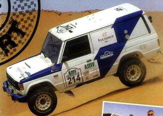
Concours de saut de dunes au cœur du désert Marocain... Si la chose est normale pour le buggy de Delahaye, elle relève de l'exploit pour les frères Tardy, ci-dessus au volant d'un Pajero de plus de vingt ans d'âge.